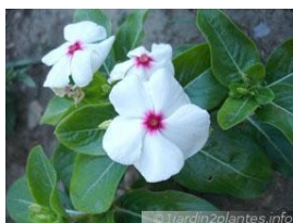
Pervenche de Madagascar