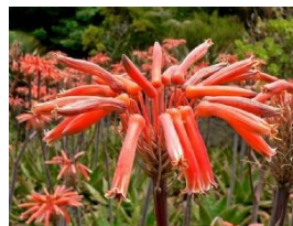
Aloe saponaria en fleurs